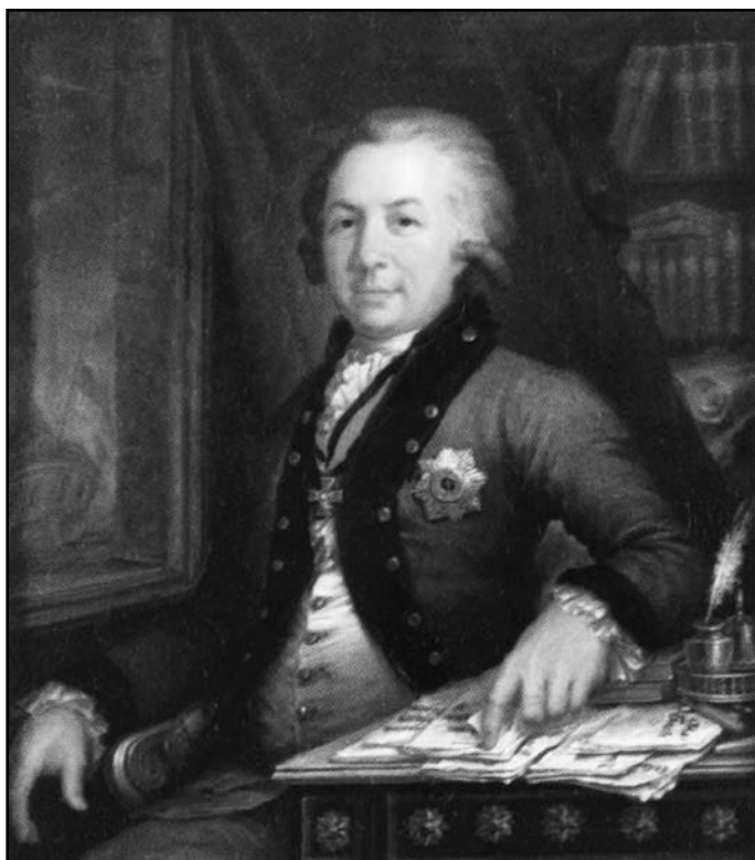
Г.Р. Державин Художник В. Боровиковский